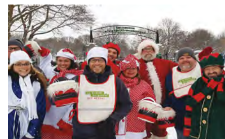
La Fabrique de la paroisse Notre-Dame de Montréal (La guignolée des médias décembre 2019)