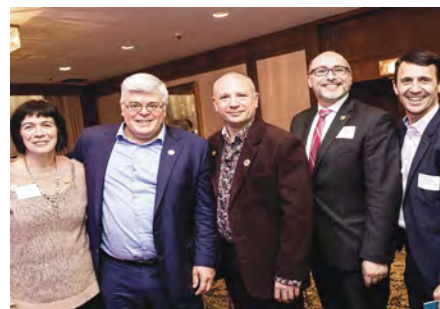
Casino de Montréal et Loto-Québec janvier 2020