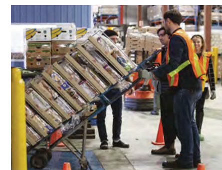
Boulangerie St-Méthode novembre 2019

A. Lasseonde inc. Boulangerie St-Méthode Courchesne Larose Fruits et Légumes Gaétan Bono inc. General Mills / Groupe Robert Global MJL Grupo Bimbo Kraft Heinz Canada Les Compagnies Loblaw Limitée (Maxi et Provigo) Metro inc. Speroway Stericycle + Collectes de divers groupes corporatifs et communautaires