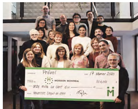
Prével février 2020