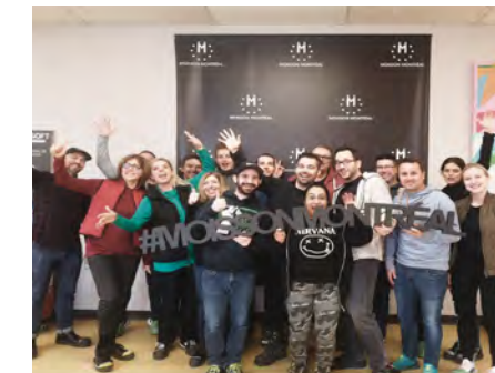
Desjardins octobre 2019

Centre François-Michelle CRDITED (Centre de réadaptation en déficience intellectuelle et en troubles envahissants du développement) Desjardins